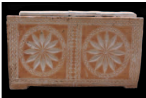
איור 2: גלוסקמה H-1373, אוסף מוזיאון הכט.

מידות: אורך: 64 ס"מ (בבסיס: 61 ס"מ); רוחב: 25.5 ס"מ (בבסיס: 23 ס"מ); גובה: 31 ס"מ.