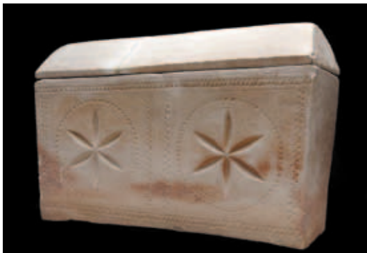
איור 1: גלוסקמה H-1372, אוסף מוזיאון הכט.

באוסף מוזיאון הכט מצויות ארבע גלוסקמות אבן (אבן גיר רכה, קירטון) ולפי המידע שברשותנו, ד"ר ראובן הכט קנה אותן בירושלים.