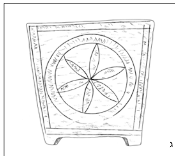
איורים 3-א-ג: גלוסקמה H-2713, אוסף מוזיאון הכט. 3-א: חזית, 3-ב: דופן צדדית (איור: ס' עד).