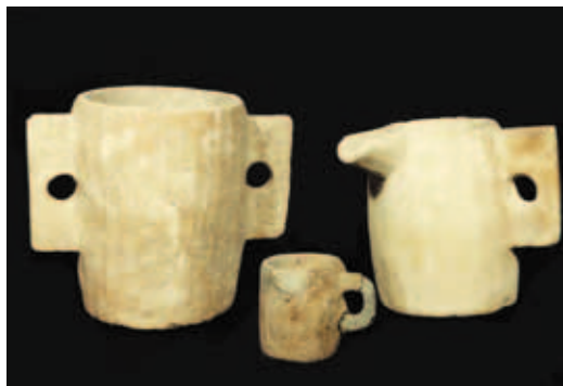
איור 5: כלי אבן מאוסף מוזיאון הכט.

מיד (קלונור וזיסו 2003: 16). מעניין לציין שהממצא הארכאולוגי גם מעיד שבצד ההקפדה על קיום חובת הטבילה, מצאו תושבי העיר העליונה של ירושלים דרך ליהנות ממעלותיו של המרחץ החם בלי שהדבר יהא בניגוד להלכות טומאה וטהרה, שאותן הקפידו לקיים (רייך 1989: 208-209).