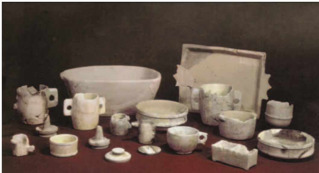
איור 6: מבחר כלי אבן מחפירות הרובע היהודי (מתוך: Geva 2010: 209, Pl. XIII-1).

2010) (איור 6). ממצא כלי האבן מרשים ביותר ויש בו מגוון כלים למגוון שימושים, כמו ספלים, קערות, אגנים, שולחנות, כלי קיבול גדולים (קלל), מכסים ופקקים. מכלול הכלים מעיד כי אף-על-פי שכלי אבן, לעומת כלי חרס, אינם נוחים לשימוש בהיותם כבדים וסופגי נוזלים במידה ניכרת, עשו מהם כלים לשימוש יומיומי. היה בכך ביטוי להקפדה וגם פתרון מעשי ויעיל, שאפשר להתמודד עם חומרתן של הלכות טומאה וטהרה.