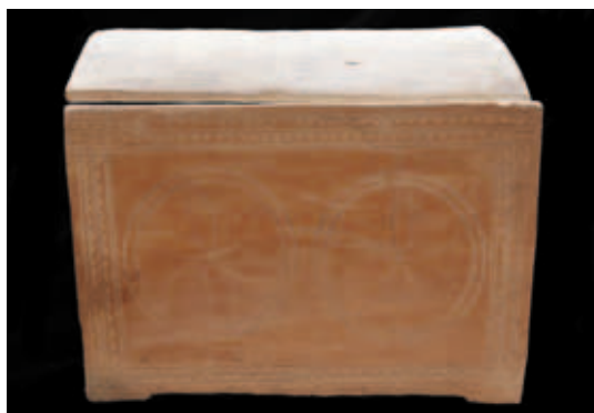
איור 4: גלוסקמה H-3468, אוסף מוזיאון הכט.

תיאור: גלוסקמה בעלת ארבע רגלים קצרות. מכסה מקומר. לזבז, מדף צר מסותת בצד הפנימי מתחת לשוליים של שתי דופנות האורך. צבועה כתום.