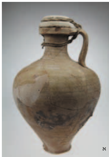
איור 8 א-ב: הצעה לפרשנות של הביטוי "צמיד פתיל": א. פקק אבן מהודק על גבי פך חרס באמצעות חוט מפותל בשקע ההיקפי או במדרגה שסביב הפקק, ומחובר אל הידית וצוואר הכלי. ב. הפך והפקק המוסר מעל פתחו – להדגמת נוחות השימוש בהתאם לפרשנות זו. הפך והפקק מחפירות פרופ' בנימין מזר בהר הבית, ירושלים.

כלי היומיום והגנה על פתחם מקבלת טומאה שחייבה את שבירתם, הייתה פתרון חיוני לכל משק בית יהודי בשלהי ימי הבית השני. הממצא הרב יחסית של מכסי ופקקי אבן מעיד שהעדיפו אותם על פני מכסים ופקקים מחומרים אחרים לא רק משום שהיו עשויים מחומר גלם זמין ונוח לעיבוד, אלא גם ואולי בעיקר משום שהמדקדקים בהלכות טומאה העדיפו אותם משום שהיו מאבן, ונחשבו כנראה לכלי שאינם מקבל טומאה. מסיבה דומה העדיפו כנראה שולחנות אבן, משקולות אבן וחפצים אחרים עשויים אבן. 5