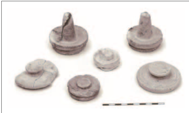
איור 7: פקקים מהבית השרוף. מתוך: Geva 2010: 172, Photo 5.5.